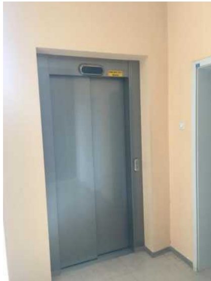
Dvigalo ZP Prebold