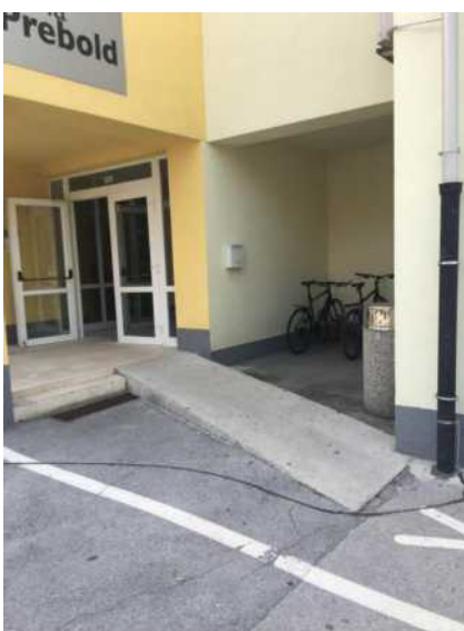
Dostop v OŠ Prebold