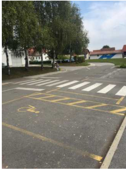
Prehod za pešce ter ponižan robnik