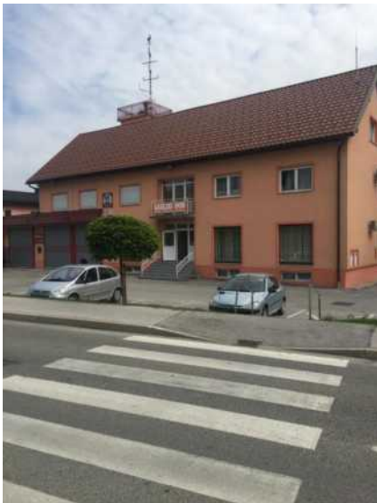
Ponižan pločnik s klančino