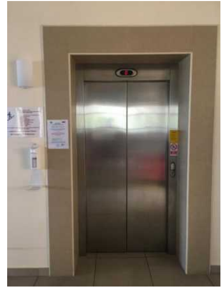
Dvigalo Dom starejših Prebold