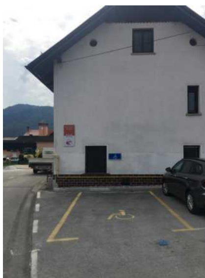
Parkirišče za invalide pri tržnici