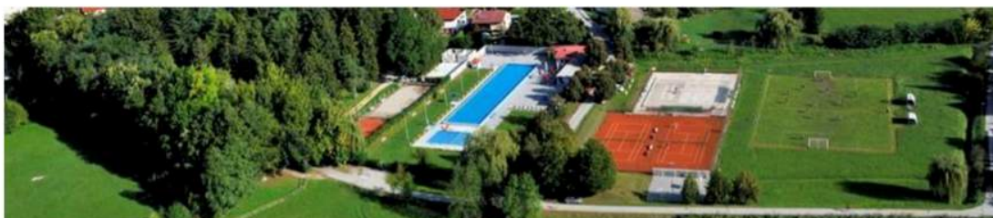
Športni park Prebold